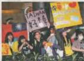
▲ 棒球運動在台灣發展已有百餘年歷史，最近在當地舉行的「2013世界棒球經典賽」也掀起了一陣「棒球旋風」呢！