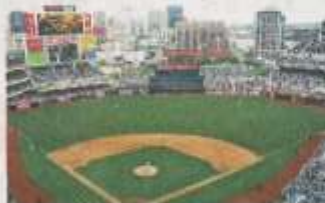
▲ 棒球的場地成扇形，除了本壘外，近外壘形的場地的角上都會放上一個壘包。

棒球比賽由人數最少為9人的兩支隊伍之間，在一個扇形的球場進行「擊球——跑位」形式的對抗。比賽中，兩隊輪流攻守。攻方球員利用球棒，將守方投手的投球擊出，沿着四個壘位進行跑壘，並成功跑一圈回到本壘，就可得1分。守方球員則需要將攻方擊出的球接住或攔回本壘，從而令攻方球員出局。九局中得分較高的一隊勝出。