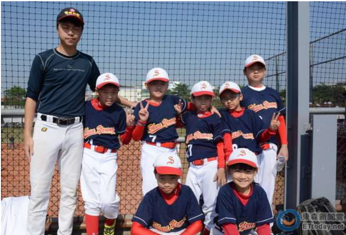
▲香港純陽小學少棒。