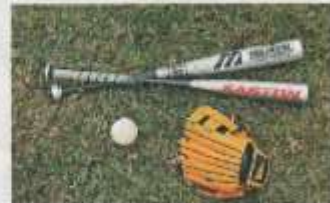
▲ 球棒、手套和棒球是棒球比賽必備的裝備，打擊者需要佩戴球盔，投手也需要佩戴面罩等來避免受傷。