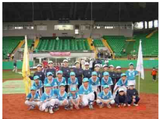
國際軟式少年棒球邀請賽花絮