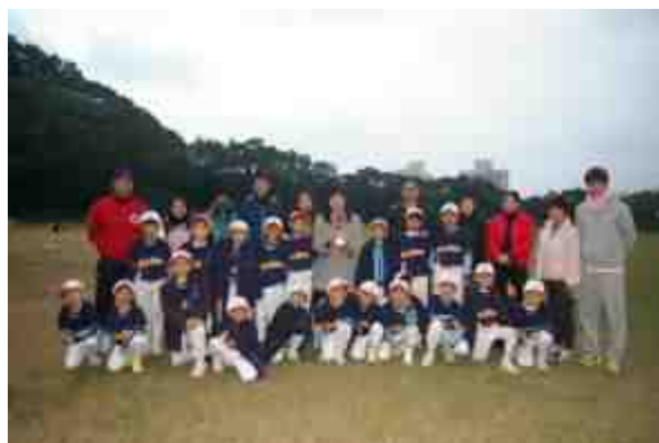
校長、家長、教練分享隊員獲獎的喜悅