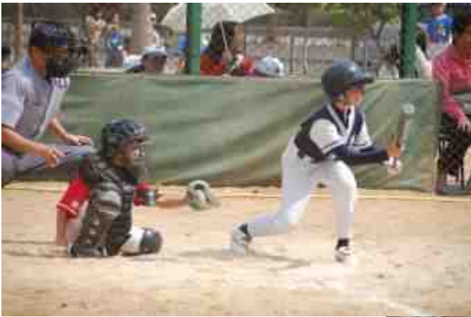
擊球員和捕手全神貫注的準備迎接投手的來球