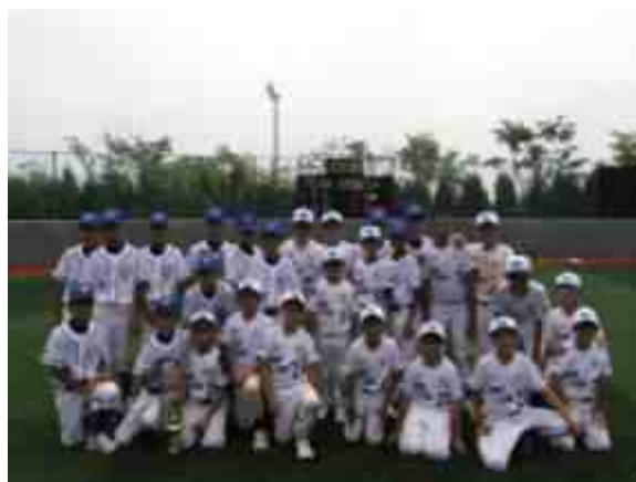
香港棒球代表隊與賽事冠軍中華台北隊合照