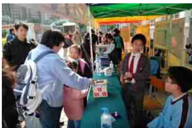
攤位遊戲：親子棒球碰碰樂