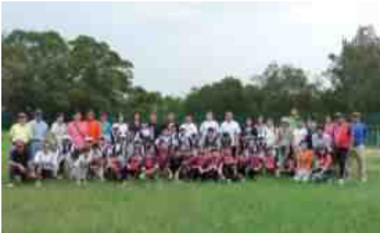
純陽小學棒球隊在香港區資格賽事中獲勝

本校棒球隊在「2009 小馬聯盟(BRONCO 組)亞太區錦標賽」香港區資格賽事中獲勝，代表香港出席於 2009 年 7 月 18-24 日，在南韓首爾舉行之比賽，與南韓、日本、中華台北等國家地區球隊爭奪殊榮。7 月 14 日，我們更參與一個簡單而隆重的香港區旗授旗禮。