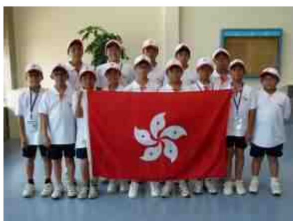
棒球隊在台北機場留影