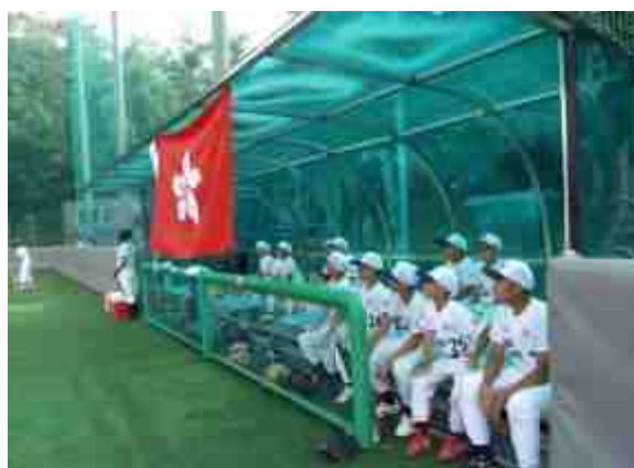
球員在廂座等待出場