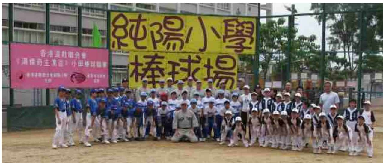
前美國職業棒球員到校探訪時，與本校棒球隊及其他參賽學校球員合照