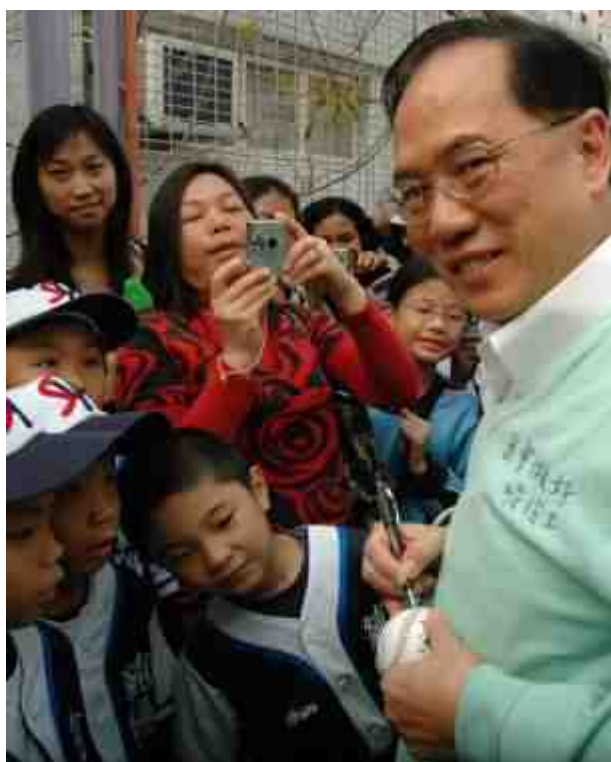
曾特首為球員簽名留念