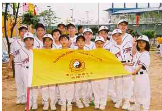
全力以赴，爭取好成績

2002 年 3 月 28、29 日，棒球隊又參加優質教育基金「沙田兒棒精英培訓計劃」邀請賽，與沙田循道衛理小學、馬鞍山循道衛理小學及沙田體育會棒球隊展開激戰，最後獲得亞軍。對於初成立的球隊來說，首年的成績實是一股動力，推動棒球隊繼續努力，爭取好佳績。