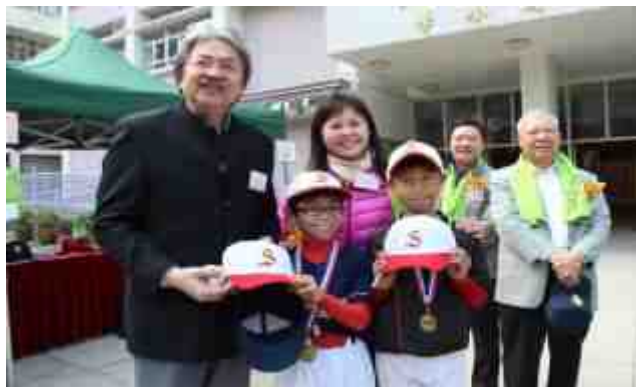
棒球隊員贈送棒球帽予曾司長

財政司司長曾俊華先生 GBM, JP 於 2014 年 12 月 28 日蒞臨本校，主持「2014 沙田節少年棒球邀請賽決賽開球禮」。