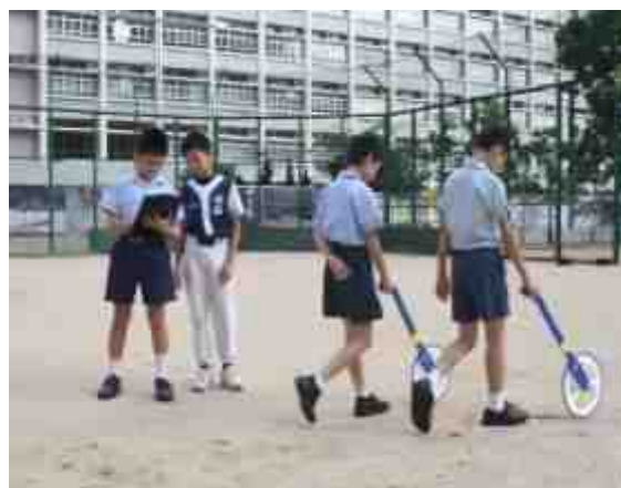
同學分別以拉尺及滾輪量度棒球場的周界