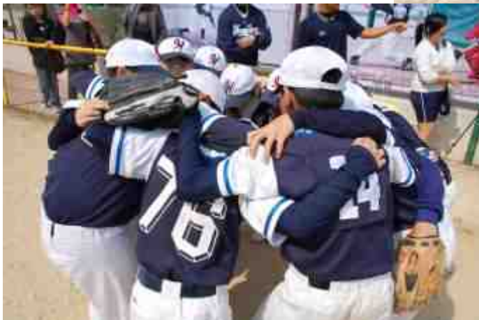
球員響應曾特首呼籲「打好呢場波！」