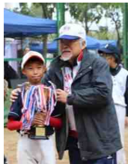
本校棒球隊在表演賽中獲得冠軍