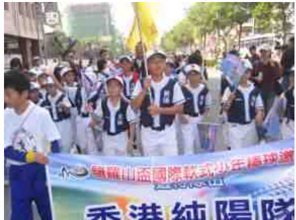
2006年諸羅山盃 國際軟式少年棒球邀請賽花絮