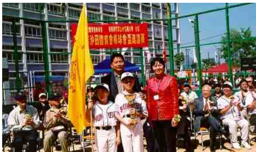
「2002 年度沙田體育會棒球會杯」本校獲「優勝杯」

棒球隊於 2002 年成立，並在 2 月 14-16 日，本校參與由沙田體育會棒球會舉辦之「2002 年度沙田體育會棒球會杯」海外少棒邀請賽，於小學組中，本校棒球隊首戰馬鞍山循道衛理小學棒球隊獲勝，得優勝杯，對起步階段的隊員，這確是一股強大的推動力。