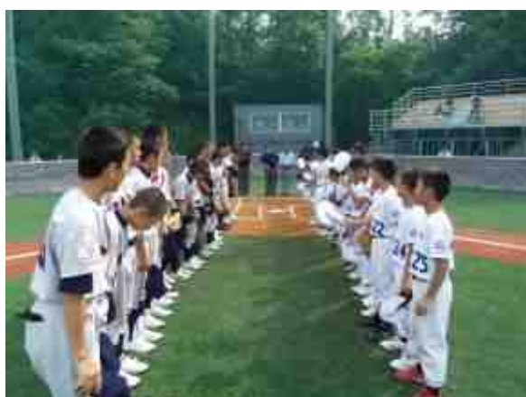
先禮後兵，雙方棒球員在比賽開始前列隊握手