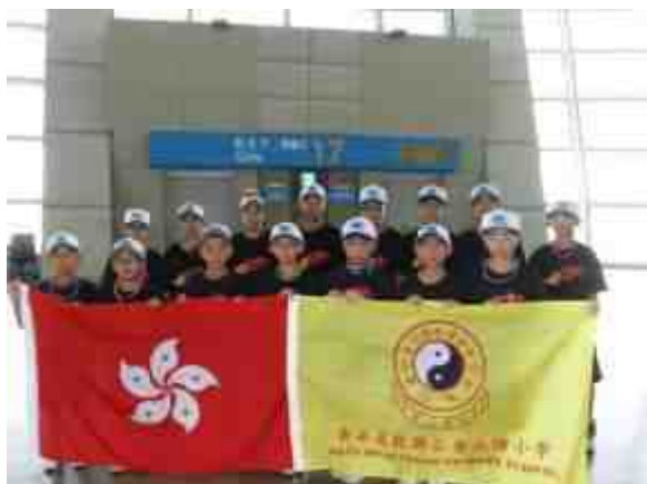
棒球員在首爾機場拍照留念