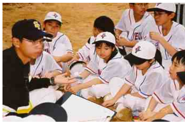
教練與球員商量戰術