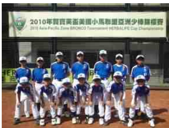
香港棒球代表隊在「美國小馬聯盟亞洲少棒錦標賽」比賽場地留影

純陽棒球隊代表香港於 2010 年 7 月 17-24 日前往台北參加「美國小馬聯盟亞洲少棒錦標賽」。賽事共有 7 個國家球隊參與，分別有中華台北、南韓、日本、菲律賓、香港、越南及印尼。雖然在小組賽中，我們輸給韓國及菲律賓，但在最後的名次賽，我們戰勝越南及印尼，獲得第 5 名，為賽事劃上圓滿句號。經過 4 場的比賽，球員無論在體能技術，以及隊形紀律等都有得著。此外，球隊返港後，又會為新一屆比賽作準備，於 7 月 25 日至 8 月 1 日前往東莞進行 8 天集訓，期間，我們亦會邀請台灣資深教練協助，提升技術之餘，又可建立球員間的默契。在酷熱的天氣下，球員聚精會神的打好每個球，家長的吶喊聲此起彼落，教練運籌帷幄，正是團隊合作的反映。參與其中，可說是獲益良多。