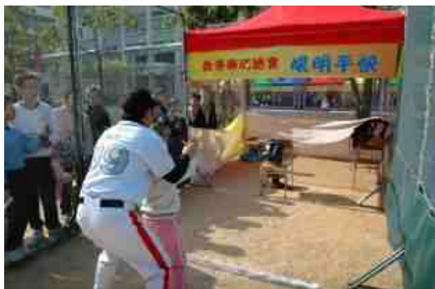
攤位遊戲：眼明手快

二零零七年一月七日，本校與香港棒球總會合辦「親子棒球樂繽紛」，一方面推廣棒球活動，另一方面將棒球元素融入中文、英文、數學、視覺藝術等學科學習之中。當日除學科活動外，學校及棒球總會還設計了多個攤位遊戲，如「眼明手快」、「聲東擊西」、棒球表演賽等，讓同學對棒球的認識更多、更深入。