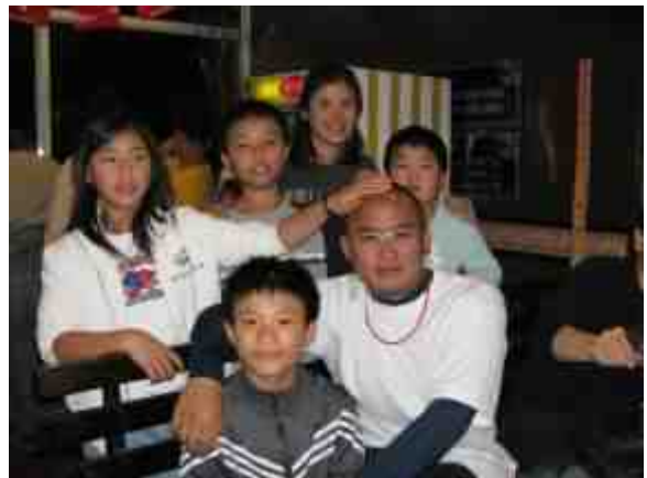
2007年諸羅山盃 國際軟式少年棒球邀請賽花絮