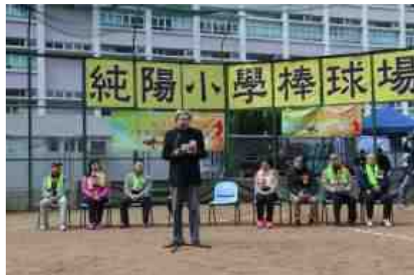
曾司長致詞勉勵各球員