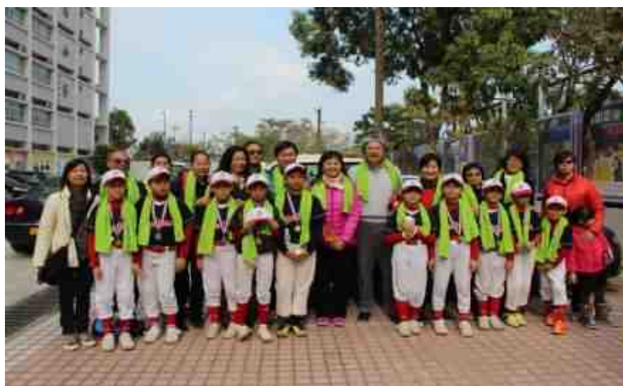
曾司長與校長、棒球員及家長合照