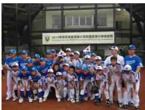
香港隊與韓國隊比賽後合照