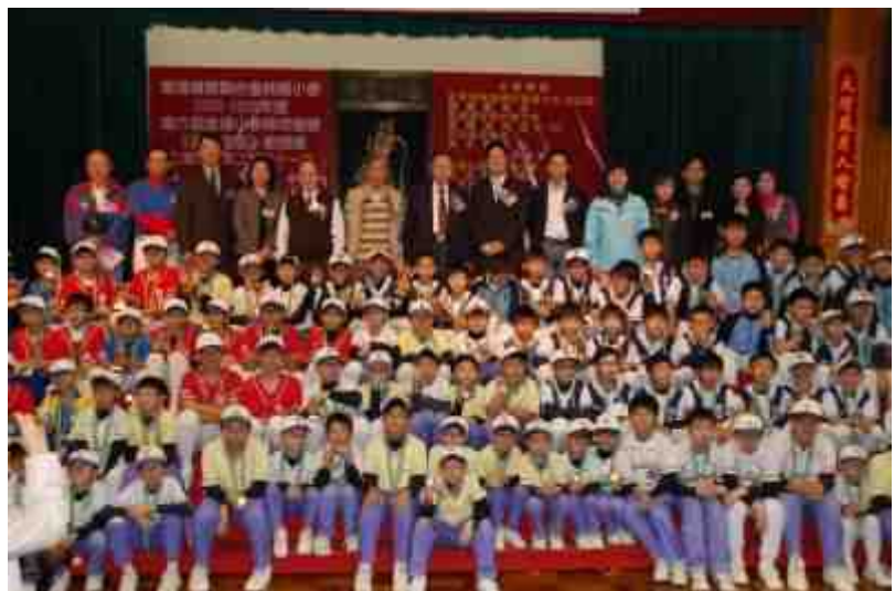
各隊球員難得聚首合照