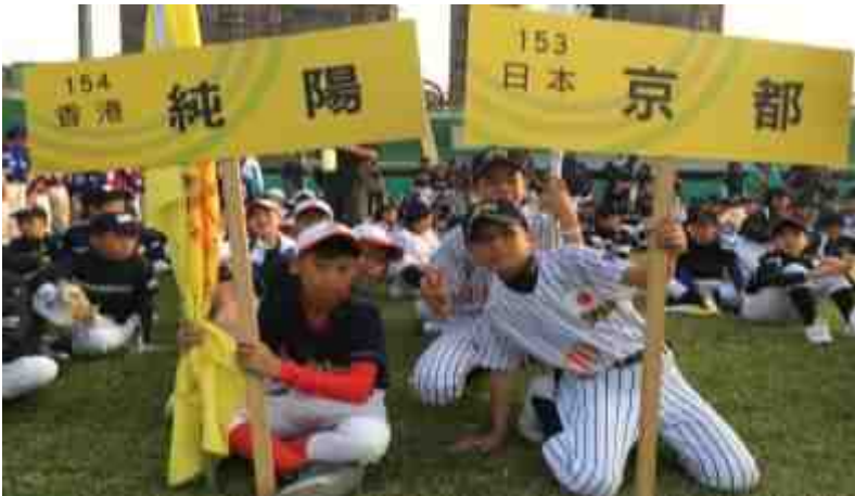
全隊球員參與巡遊活動，在嘉義市棒球場舉行開幕典禮