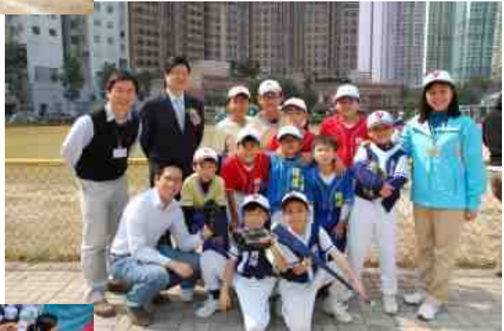
楊文銳議員、校監和校長與各隊球員合照