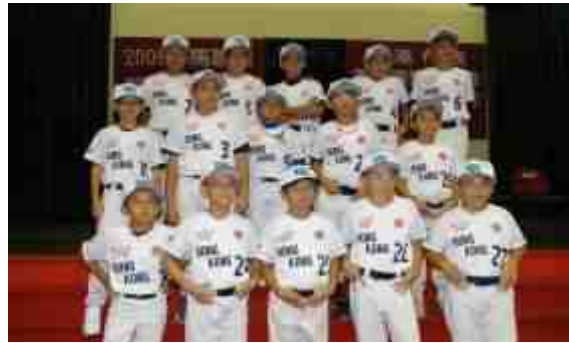
15 位參與「2009 小馬聯盟(BRONCO 組)亞太區錦標賽」的香港棒球隊代表