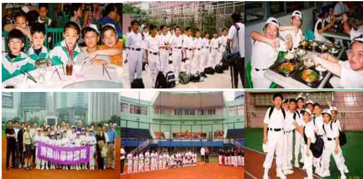
廣州集訓之旅花絮

棒球隊於復活節期間 2002 年 3 月 31 至 4 月 2 日，聯同沙田體育會棒球會隊員北上廣州，進行一連三天的集訓。隊員還參觀【中國職業棒球聯賽】廣東隊主場-----「天河棒球賽」，到桂花崗小學觀課，參加升旗禮，進行友誼賽等，不但增進球員的棒球技術，更是一次難得的中港文化交流。