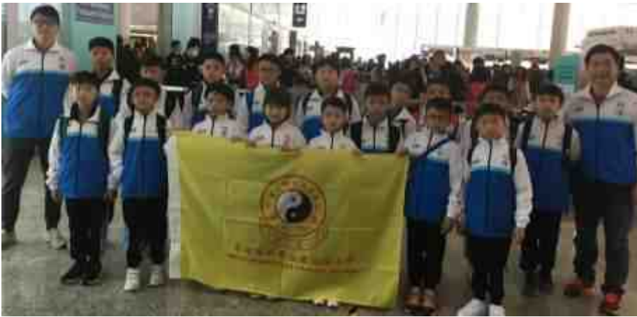
出發前在香港機場影大合照