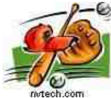
2008年諸羅山盃 國際軟式少年棒球邀請賽花絮